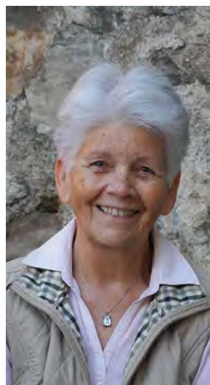
Un beau sourire pour les malades.

Actuellement, quatorze personnes (certaines étaient déjà là au tout début) consacrent leur jeudi après-midi à cette tâche. Un tournus est établi.