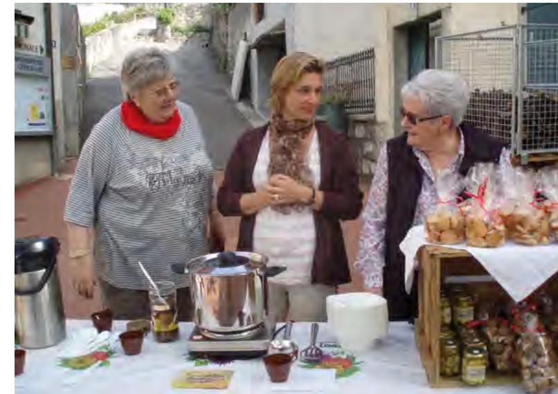
Ambiance, échanges, contacts.

Il est né en décembre 2011, à l'occasion de la traditionnelle vente des sapins de Noël de Riex. Suite au succès rencontré lors de la première, le Marché de Riex a donc été planifié six fois en 2012. Son but est de don-