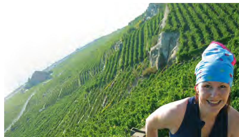
Coaching à travers les vignes

Tout d'abord pour des bien-portants désirant maintenir ou regagner leur souplesse par un bon travail de leurs articulations et de leur musculature et affermir leur équilibre. « Se reprendre en charge » pour un quotidien moins