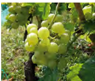
Vins, vignes et vigneron (pages 2 et 3)