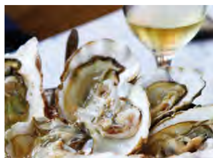
Fraîcheur et qualité.

Invasion d'huîtres à Aran, samedi 30 novembre : sous le signe de la qualité des produits et d'une ambiance de convivialité amicale, l'association des vigneron de Villette proposera, pour la 20 e année consécutive, la fameuse journée « Des huîtres et du Villette », à la salle des Mariadoules, de 10h30 à 19h00.