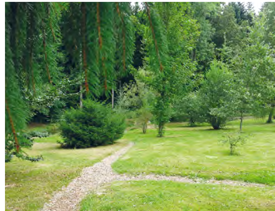
Comme un coin de Paradis...