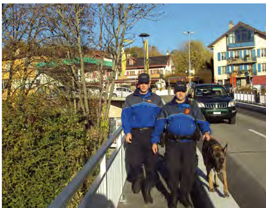
«Protéger et servir», devise de l'APOL.

En septembre 2009, le choix du peuple s'est porté sur une police de proximité, basée sur la coexistence entre police régionale et cantonale. Depuis janvier 2012, l'APOL (Association Police Lavaux) a ainsi repris le contrat de la prévention, de l'administration et de la répression dans notre région. Cette nouvelle organisation n'a pas été choisie au hasard : elle permet une meilleure sécurité, en privilégiant une coordination et une cohérence dans l'intervention policière.