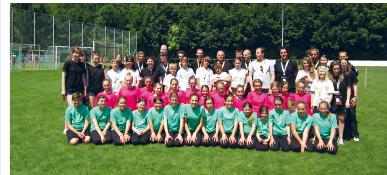
Une forte délégation de gymnastes de Bourg-en-Lavaux.

Les 15 et 16 juin dernier, la Fédération Suisse de Gymnastique de Cully a rejoint les 17000 jeunes qui ont participé à la fête fédérale de gym. Organisée tous les 6 ans, cette grande aventure avait lieu à Bienne.